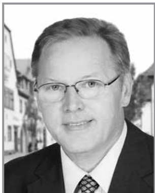
37 Reiner Dalkowski